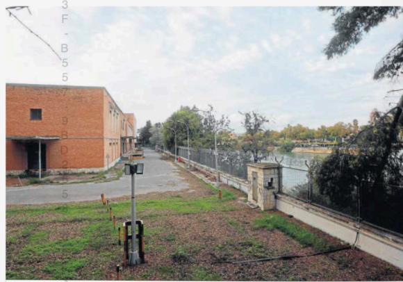
Estado actual de la zona más cercana al Guadalquivir.