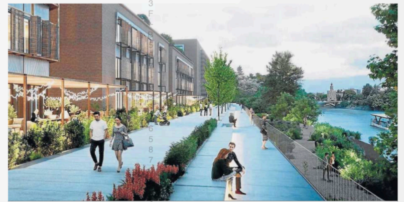
Recreación del paseo fluvial que contará con dos alturas.

El equipo de diseño se fija en la reforma realizada en la avenida del Greco